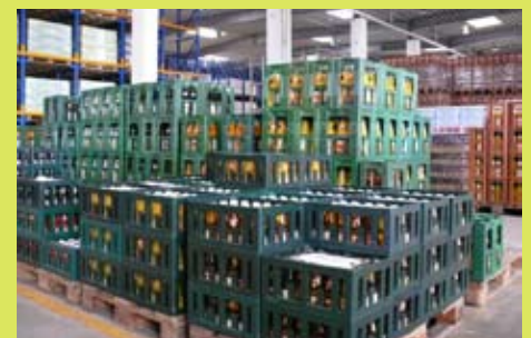
Fruchtquell Dodow unterstützt die BUGA