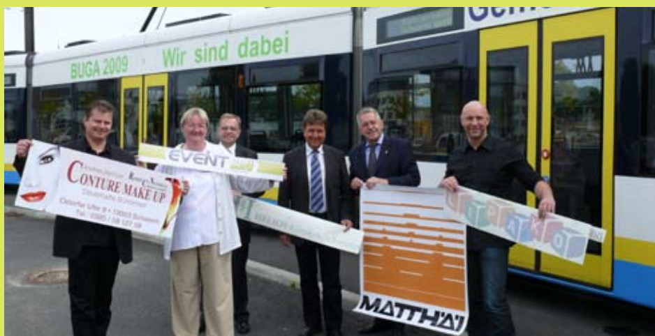
Auf der BUGA-Werbepbahn ist noch ausreichend Platz für Firmenlogos

Für 500 Euro, die an die Bundesgartenschau GmbH gehen, bekommen Sie im Gegenzug eine 1 Meter große Werbefläche mit ihrem Firmenlogo auf einer Bahn des Nahverkehrs. Die Linie fährt im gesamten Schweriner Straßenbahnnetz. „Damit haben die ‘Unterstützer’ eine attraktive Werbefläche bis zum Ende der Bundesgartenschau hier in unserer Landeshauptstadt“, weiß