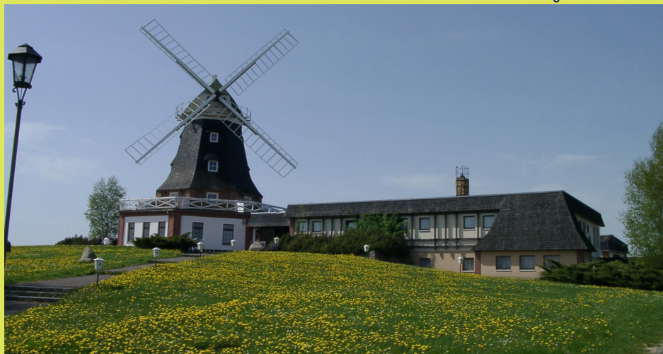
Die Klützer Mühle

Das Ostseebad Boltenhagen und die Stadt Klütz mit dem Klützer Winkel präsentieren sich dem Besucher nicht mit rein gärtnerischen Themen zur Bundesgartenschau 2009. Es ist vielmehr die besondere Landschaft, die es zu entdecken gilt. Und wie ginge dies besser, als mit dem Fahrrad. Eine gekennzeichnete BUGA-Route wird deshalb 2009 von Schwerin bis nach Boltenhagen führen.