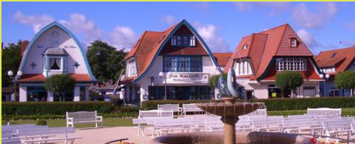
Wandern, Baden und Entdecken im Ostseebad Boltenhagen

Das Ostseebad Boltenhagen und die Stadt Klütz präsentieren sich gemeinsam zur Schau