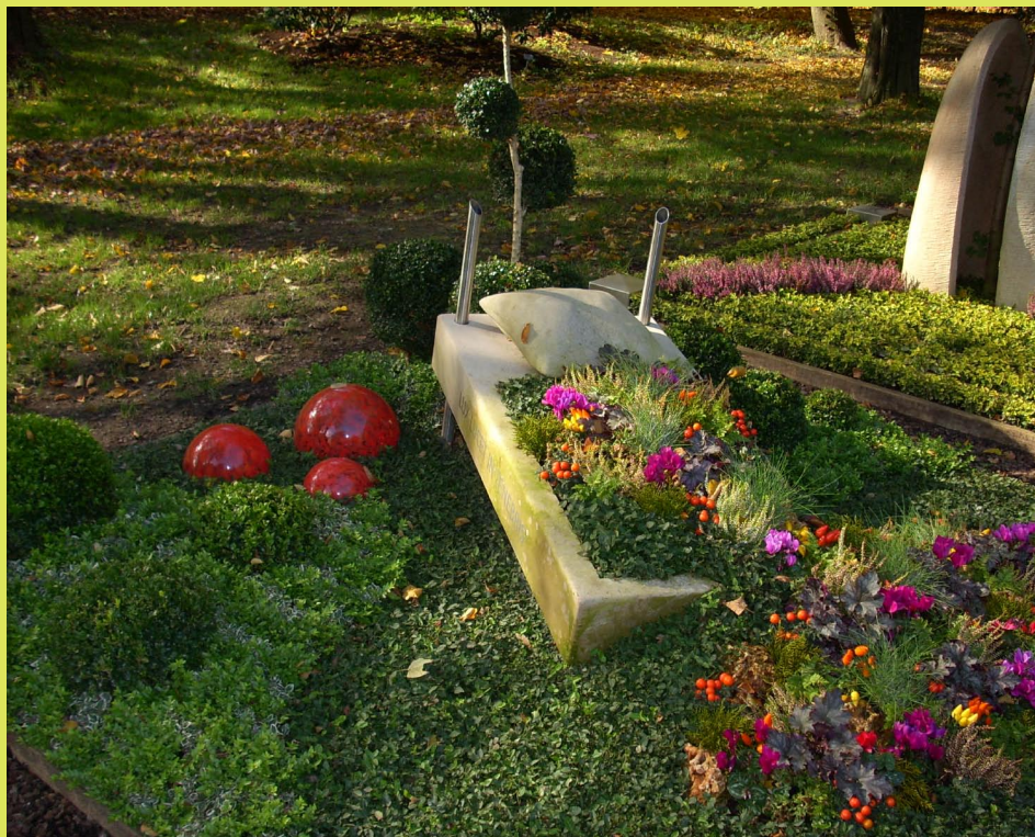
Beispiel für eine Grabgestaltung