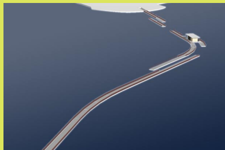
Die geplante Wasserquerung vom Ufergarten zum Garten am Marstall Grafik: BUGA

zu bringen und vor Ort wieder zusammen zu fügen, hätte die Kosten enorm in die Höhe getrieben. So blieb als letzte Möglichkeit noch ein Schwimmsteg. An dieser Lösung wird derzeit intensiv gearbeitet. Dabei ist einiges zu berücksichtigen: Wegen der Weißen Flotte kann die Schlossbucht nicht einfach abgesperrt werden. Ein mindestens zehn Meter breiter und vier Meter hoher Durchlass muss gewährleistet werden. Für Rollstuhlfahrer oder auch Familien mit Kinderwagen muss eine spezielle Lösung her. All diese Probleme können aber aus dem Weg geräumt werden. Nach den bisher vorliegenden Angeboten wird ein solcher Schwimmsteg jedoch etwa 800.000 Euro teurer, als ursprünglich geplant. „Wir arbeiten jetzt intensiv daran, die Kosten im Rahmen zu halten“, zeigt sich der Technische Leiter der Bundesgartenschau 2009, Reinhard Henning, optimistisch. „Wir suchen nach Nachnutzungsmöglichkeiten für die Pontons. Für Marinas oder Sportboothäfen wären sie bestens geeignet. Und kostengünstiger als ein Neukauf sind sie für die späteren Nutzer allemal.“